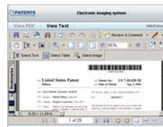
View Patent PDF Images